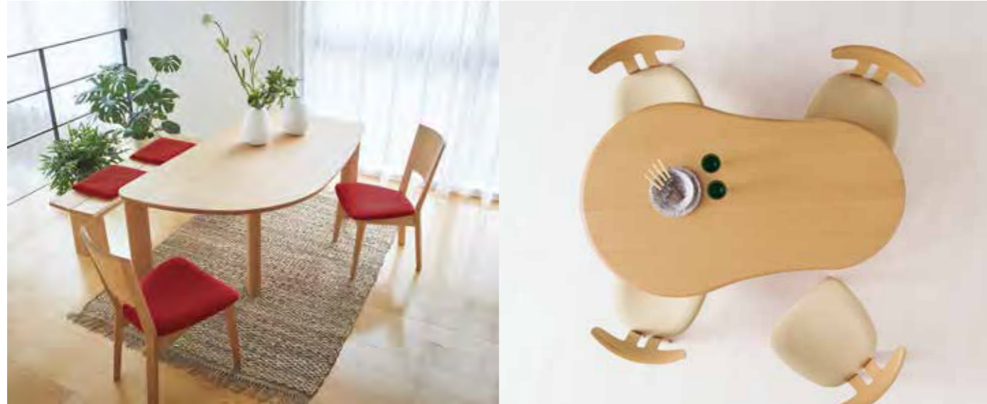
Table | NEO