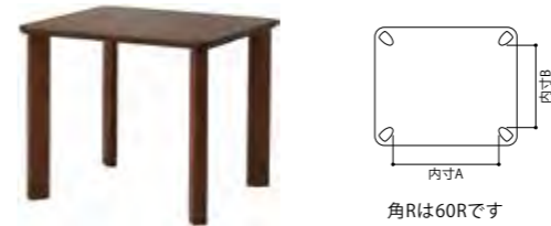
V-4 型 | 小型長方形 4 本脚 (NEO コンパクトテーブル)